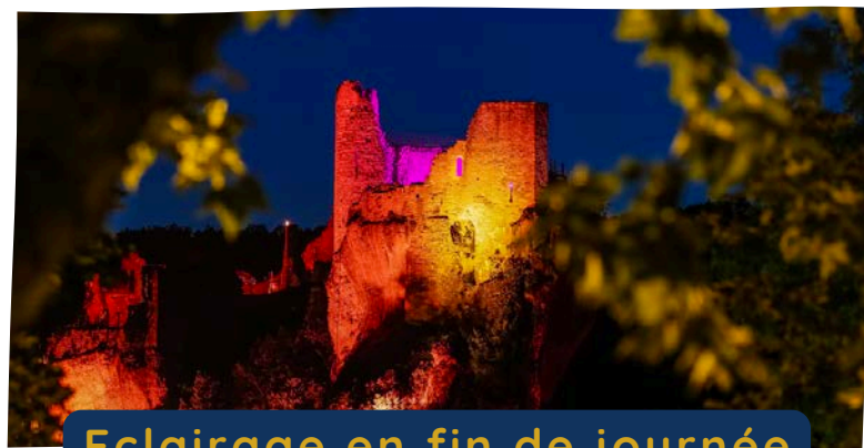
Eclairage en fin de journée