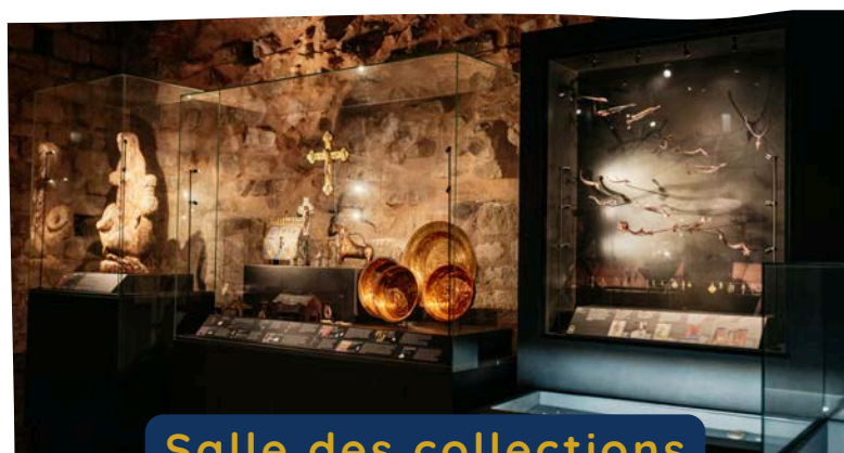
Salle des collections

Offrez-vous une escapade au cœur de la forteresse ! Profitez d'une visite en autonomie entre panneaux explicatifs, espace muséographique chaleureux et sentier paysager qui dévoile ses plus beaux panoramas hivernaux.