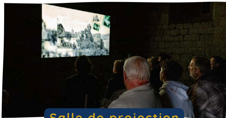
Salle de projection